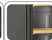
Maniglia cilindrica esterna in acciaio (Colore nero)