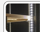
Luce interna LED verticale